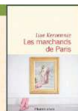
LES MARCHANDS DE PARIS Lise KERVENNIC Flammarion

La vie de chirurgien est un sacerdoce : 12 ans d'études harassantes pour apprendre à soigner et sauver. Lisa Sanchis conte avec humour et pédagogie la mise à l'épreuve d'une vocation. Elle dessine le parcours du combattant d'un chirurgien, de sa vocation enfantine à la désillusion, en passant par les années d'internat, dévoilant la vie des médecins et la crise de l'hôpital public. Entre fatigue, drames et joies, cette bande dessinée rend accessible avec le sourire un métier dur et magnifique.