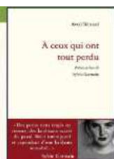
À CEUX QUI ONT TOUT PERDU Avril BÉNARD Éditions des Instants

L'auteur lauréat remportera la somme de 300€, offert par Loudéac Communauté. Les ouvrages sont en rayon à la bibliothèque. N'hésitez pas à venir les emprunter !