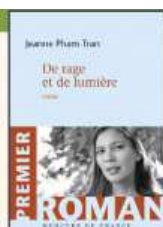
DE RAGE ET DE LUMIÈRE Jeanna PHAM TRAN Mercure de France

Comment peut-on faire, en une heure, le bagage de toute une vie ? C'est la guerre : des soldats ont l'ordre d'évacuer des civils qui doivent n'emporter qu'un seul sac. Il y a Manon et Jeanne, Paul, Marek, madame Dépalle, une famille nombreuse, Shoresh, deux âmes. Dans l'urgence des choix, le passé et le présent se mêlent, les âtres se révèlent, se montrent tels qu'ils sont. À quoi tient-on le plus ? Qu'est-ce qu'on ne peut abandonner ? Que veut-on transmettre ? Quel espoir peut encore briller ?