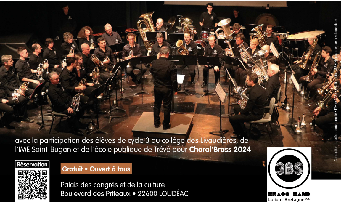
avec la participation des élèves de cycle 3 du collège des Livaudières, de l'IME Saint-Bugan et de l'école publique de Trévé pour Choral'Brass 2024