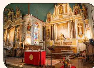
Visite virtuelle de l'église Notre-Dame

ORGANISÉ PAR L'ASSOCIATION GRACIEUX PATRIMOINE