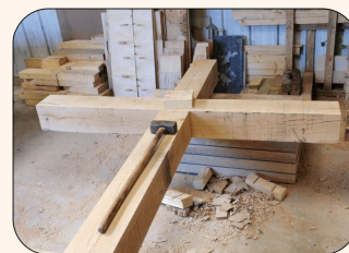
Croix du bas du bourg RDV à la Croix à 11h